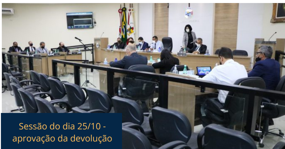
Sessão do dia 25/10 - aprovação da devolução